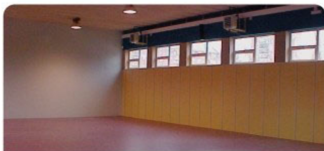
Interior del gimnasio del CEIP Vicente Aleixandre de Martorell, similar al que se construirá en el CEIP Jaume Balmes.

Con estas mejoras la calle Riu Llobregat se convertirá definitivamente en el eje principal del barrio. Una calle bien preparada para el comercio, el paseo y la relación ciudadana.