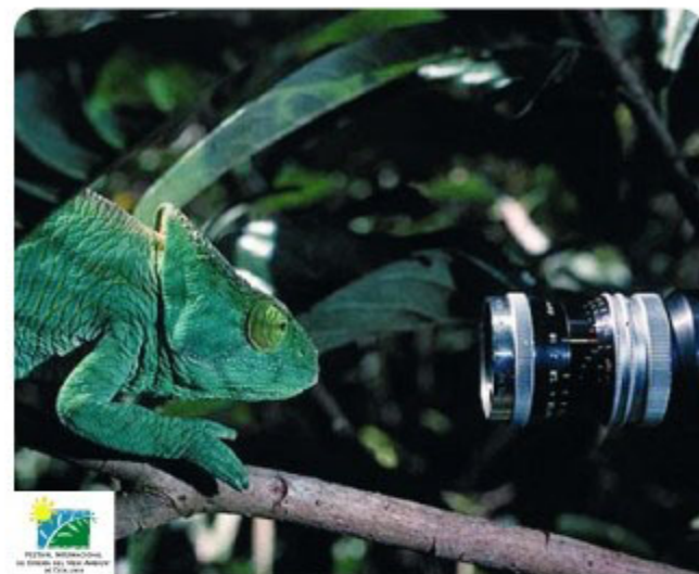
El proper festival de Medi Ambient es celebrarà al Prat entre l'1 i el 10 de juny de 2007

El centre de Serveis Educatius, juntament amb el Centre Esplai, la nova comissaria dels Mossos, la nova seu d'Aigües del Prat i l'ampliació i millora del CAP convertiran aquest punt del carrer del Riu Llobregat en un dels majors centres de gestió del Prat de Llobregat.