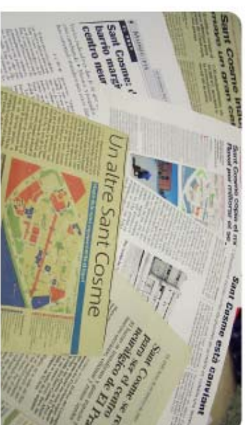
A l'Oficina trobareu un recull de premsa amb les notícies de Sant Cosme

ADIGSA, ha aprobado un nuevo paquete de ayudas complementarias para la instalación de ascensores. Estas nuevas ayudas se suman a las que ya ofrece conjuntamente con las del Ayuntamiento. Pasad por la Oficina Municipal y os informaremos con más detalle.